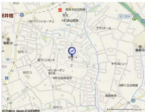
川口市新井宿付近の住宅地図