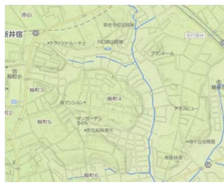
川口市新井宿付近の地形図